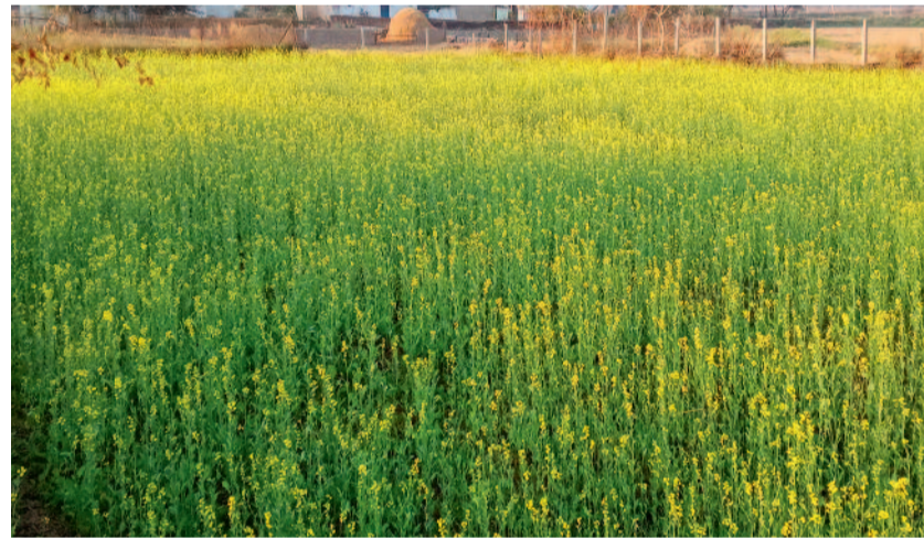
पलारी। ब्लॉक के घिरघोल गांव में किसानों के खेत में सरसों का फसल लहलाते मनमोहक दृश्य।